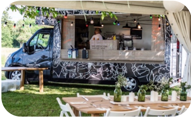
FOOD TRUCK | L 6.45M | B 2.28M | H 3M