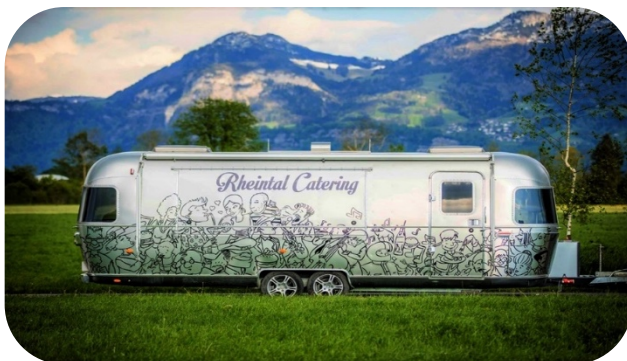
AIRSTREAM | L 6.8M + 1.2 = 8M | B 3.6M | H 3M