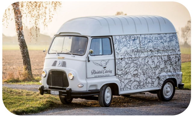
OLDTIMER L 5.30 M | B 1.5 M | H 2.40 M