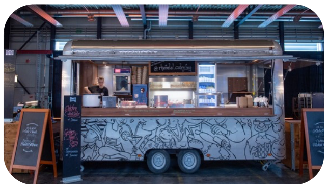
ZOO ANHÄNGER | L 5.55 + 2.58M = 7.08M | B 3M | H 3.5M